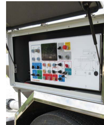
Panel with monitor Kontrollpanel med display för operation och processövervakning