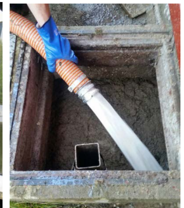
Wasserrückgabe in Sickergrube Retour de l'eau dans la fosse septique