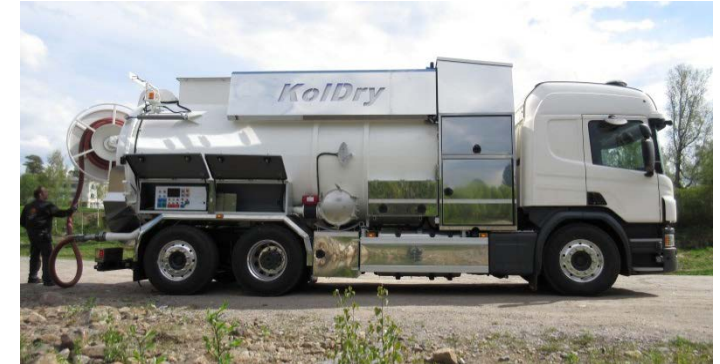
Sickergrubenentleerung mit KolDry Vidage d'une fosse septique avec KolDry

La manipulation du KolDry est très simple. Une caméra montée dans le réservoir permet de surveiller le processus d'assèchement. Le retour de l'eau se fait via le même tuyau souple qui avait servi au début à l'aspiration de la fosse septique.